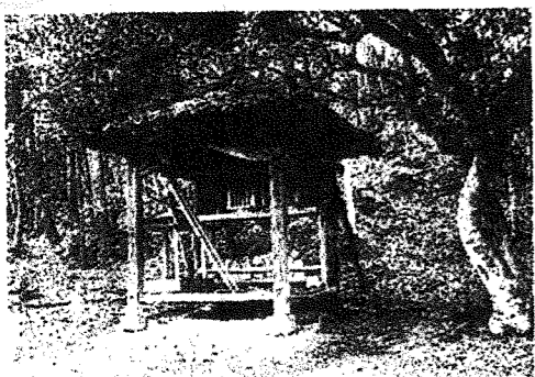
観音堂 (下組 猿谷)