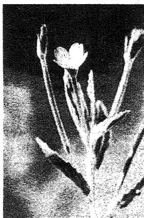
《アカバナユウゲショウ》

夕方頃に花を開き、白地に赤い化粧をしたような美しい花を咲かせることからユウゲショウ(夕化粧)と呼ばれる。実際は昼間でも花がみられる。