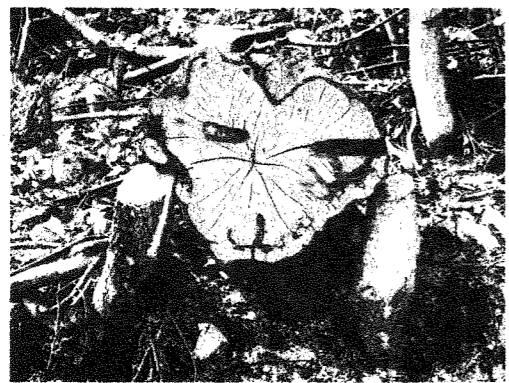
「皆さん何に見えますか」