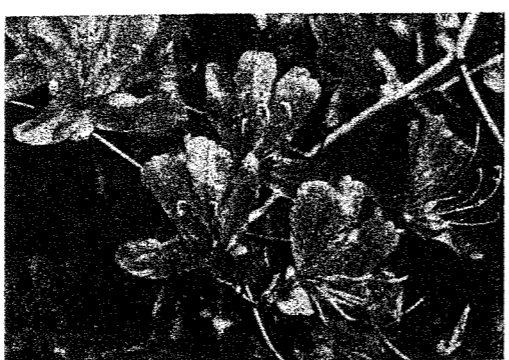
《コバノミツバツツジ》

葉っぱが小さく、枝先に三枚ずつ輪生するのが特徴で、これが名の由来である。 ※四月一九日撮影