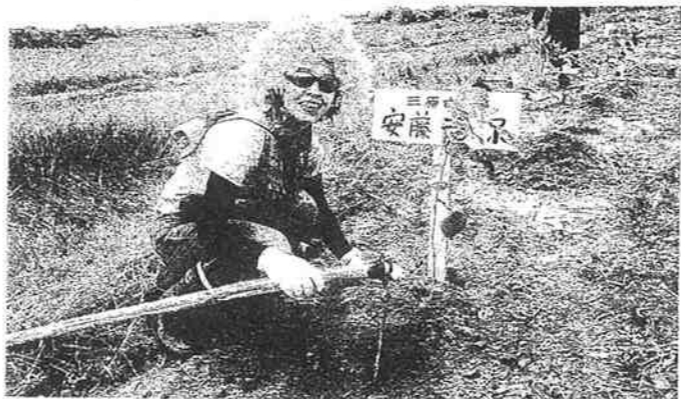
アマソンの土は覆せていて植林の前の土づくりが大変!!!紫イッペーの木を植えました!