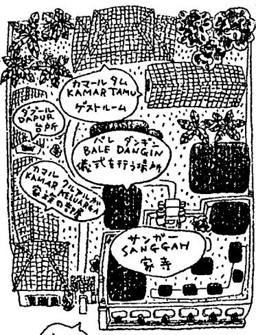
バリの家を上から見た図

この島の人々は、親を大切に、先祖を崇拜する。我が国では、家の内に仏壇を設けるが、バリ島では、屋敷内に立派なサンガ(家寺)を造る。そして、祖先の霊が屋敷内にあるということ、毎日の供養を欠かさない。また、村ごと集落ごとに、それぞれ荘厳なお寺も建てている。